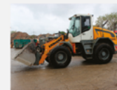
Kolový nakladač Liebherr L550