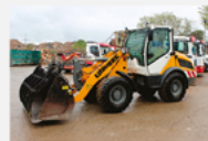
Kolový nakladač Liebherr L508 C