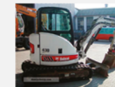
Minibagr Bobcat E43